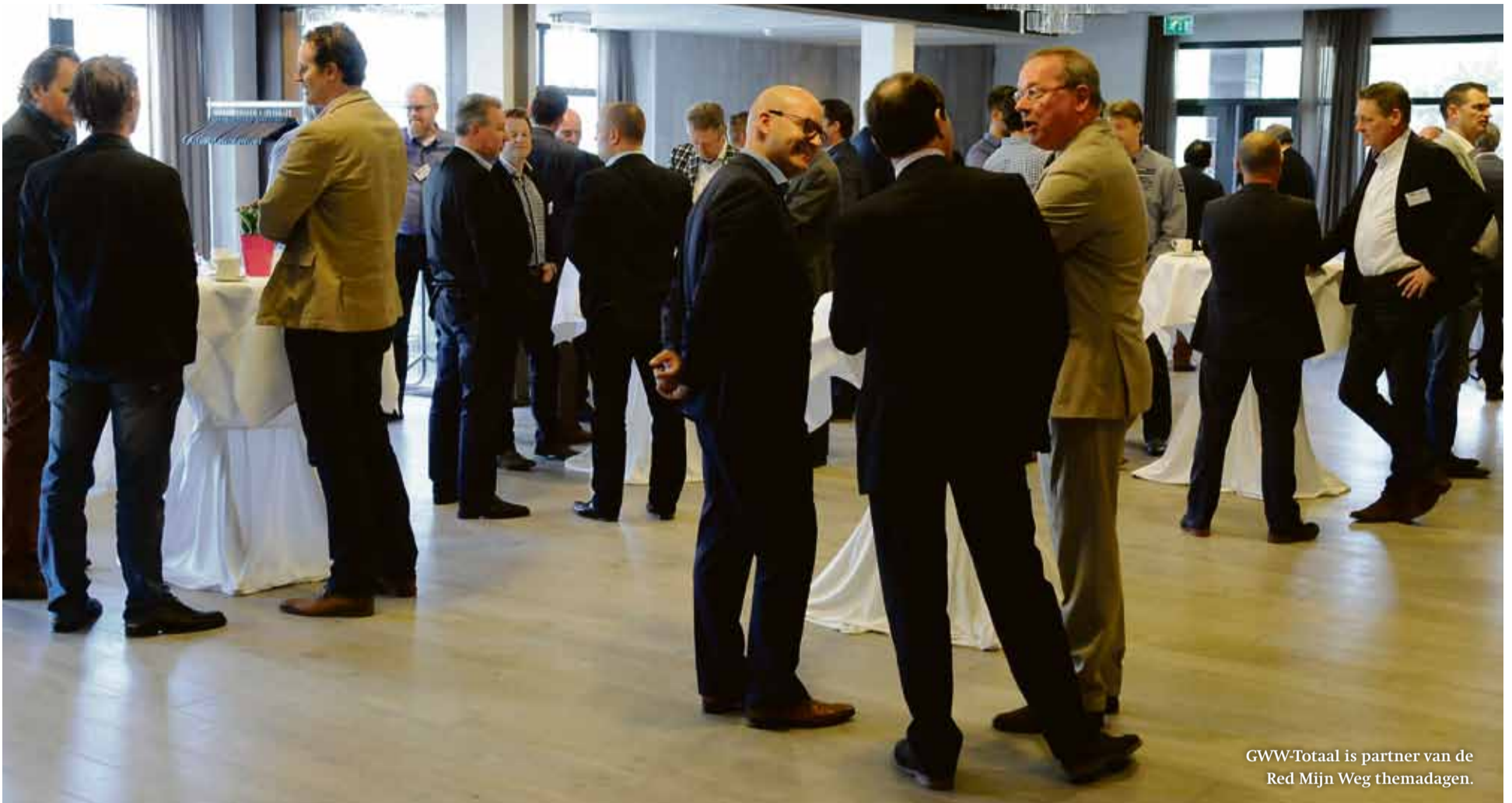
GWW-Totaal is partner van de Red Mijn Weg themadagen.

150 kamerleden. Uiteindelijk worden daar beleidsdocumenten en budgetten vastgesteld.'