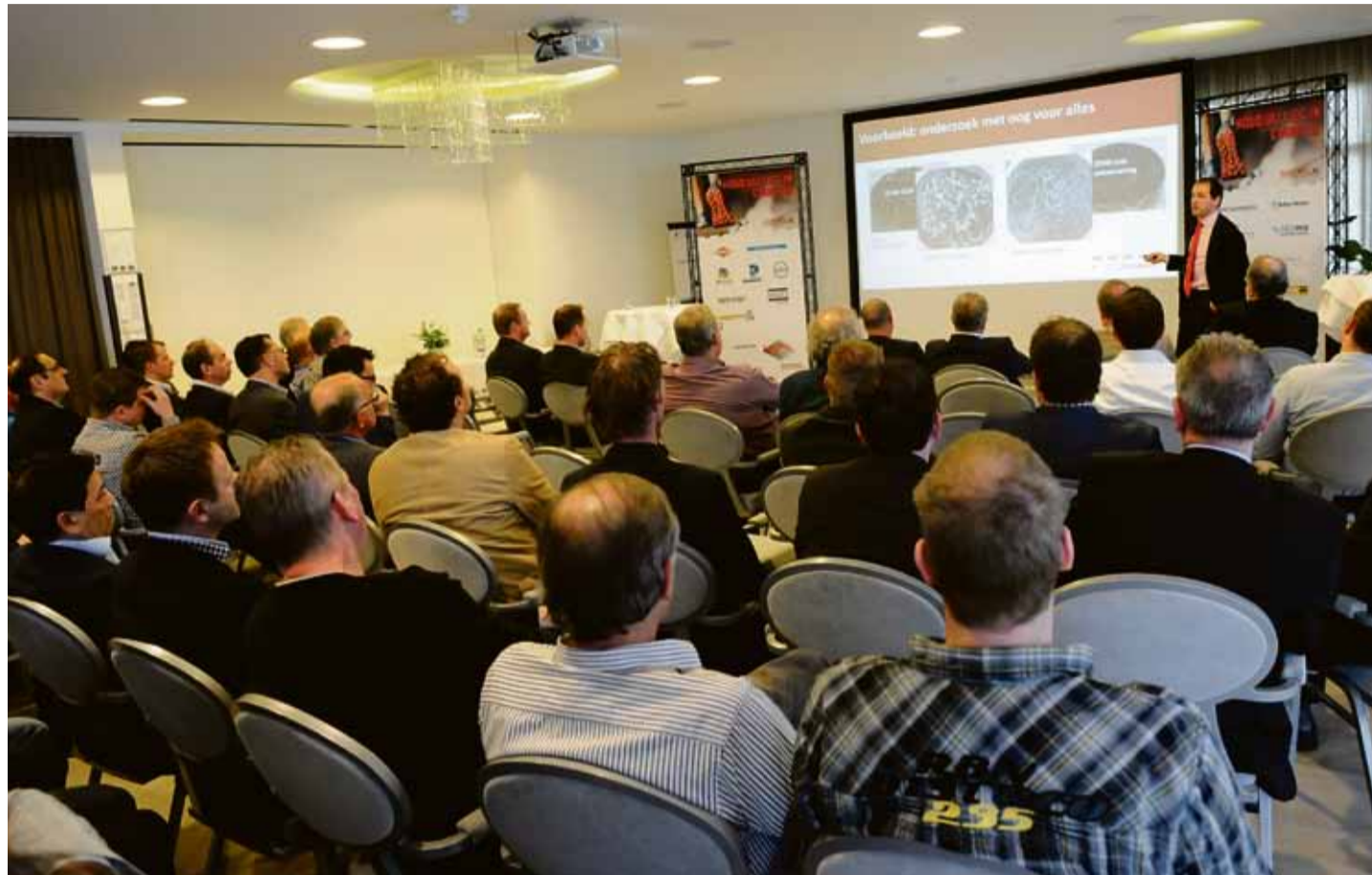
De drie Red Mijn Weg themadagen werden weer goed bezocht, zoals hier in Arnhem.